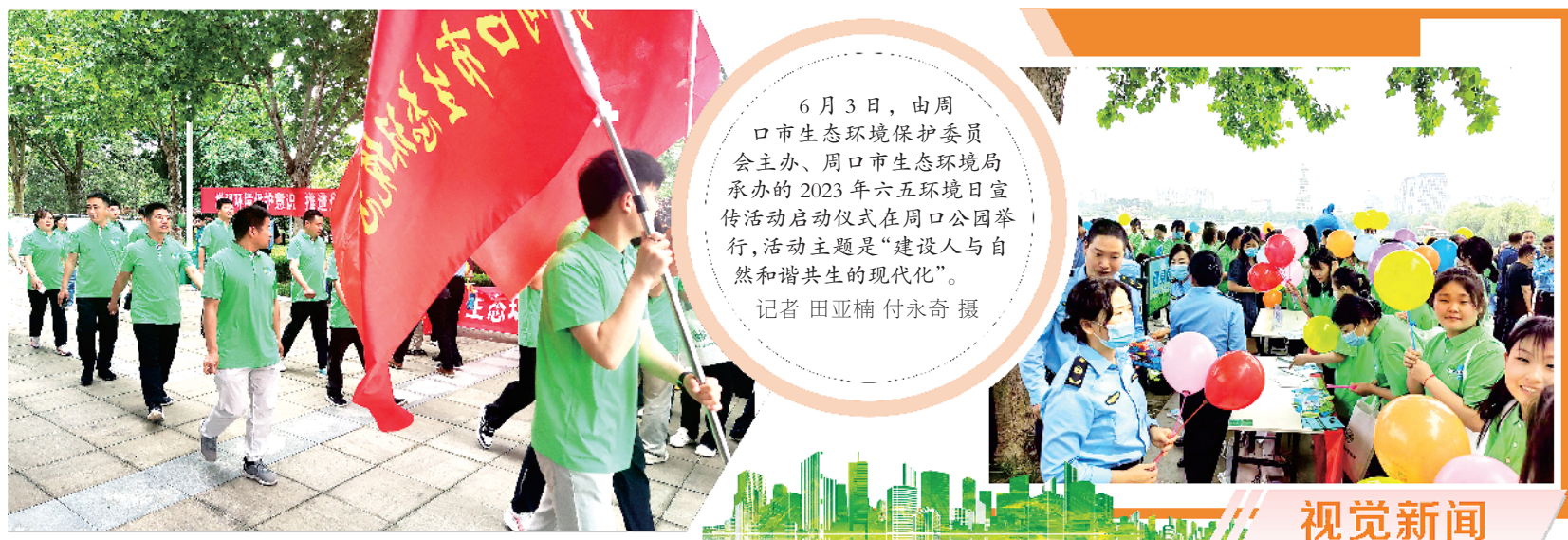
6月3日，由周口市生态环境保护委员会主办、周口市生态环境局承办的2023年六五环境日宣传活动启动仪式在周口公园举行，活动主题是“建设人与自然和谐共生的现代化”。