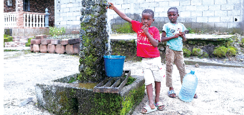
中国企业帮助赤道几内亚村民解决用水难问题

戴兵表示,中国领导人提出全球文明倡议,倡导尊重世界文明多样性,倡导弘扬全人类共同价值,倡导重视文明传承和创新,倡导加强国际人文交流合作。全球文明倡议同全球发展倡议、全球安全倡议,共同成为新时代中国为国际社会提供的重大公共产品,为破解世界现实难题、推动人类和平发展进步贡献中国智慧。欢迎各方积极参与相关倡议合作,为推动构建人类命运共同体作出共同努力。