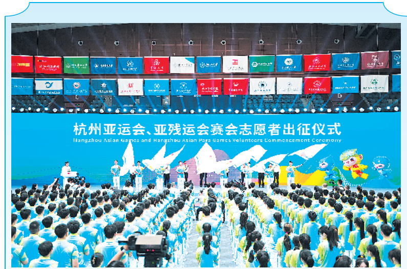
杭州亚运会、亚残运会赛会志愿者出征仪式举行

办法明确,粮食经营者对粮食质量安全承担主体责任。从事粮食经营活动,应当严格执行有关法律、法规、政策及标准,严格遵守粮食质量安全管理规定,明确质量安全管理责任,认真落实反食品浪费、粮食节约等有关规定和要求,严禁多扣水杂、压级压价、以陈顶新、掺杂使假、以次充好等行为。