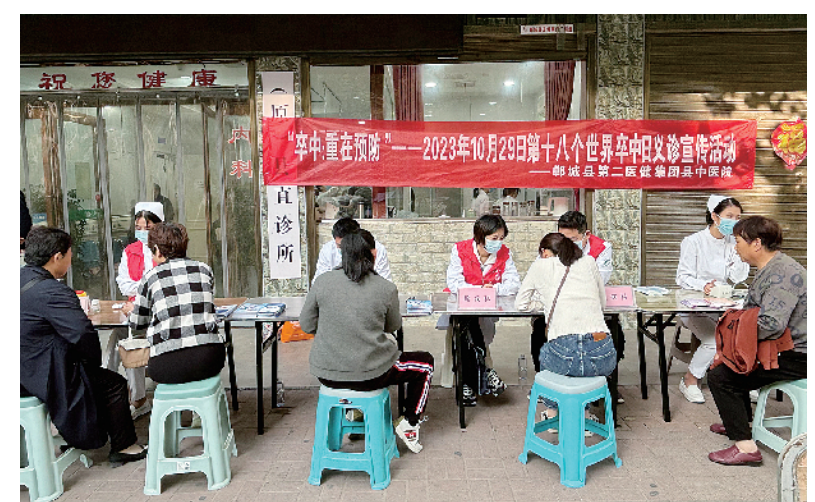
医护人员为居民把脉问诊、答疑解惑。

本报讯(记者徐松 通讯员张译文/图)10月30日上午,郸城县第二医疗健康服务集团县中医院医护人员在县直诊所开展“世界卒中日”义诊宣传活动。 卒中,俗称“中风”,具有发病率高、致死率高、死亡率高和复发率高的“四高”特点。该病发病急、病情进展迅速、后果严重。居民如果能及早识别卒中症状,在发病5小时内将患者送医治疗,多数患者可以明显恢复,甚至完全恢复。因此,早发现、早治疗,对卒中