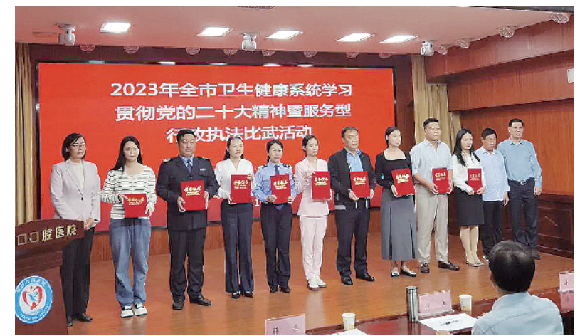
郸城县卫生计生监督所获奖人员上台领奖。

本报讯(记者徐松 通讯员侯同廷 文/图)近日,市卫健委联合市总工会开展全市卫生健康系统学习贯彻党的二十大精神暨服务型行政执法比武活动,各县(市、区)卫生健康委及部分市直医院参赛。郸城县卫生计生监督所获团体一等奖和普法宣传员三等奖。 本次活动有普法宣讲员选拔和模拟执法两个环节。活动中,参赛队员选取工作中的典型案例,“再现”行政执法过程,生动诠释管理、执法、服务“三位一体”的新型行政执法模式,全方位