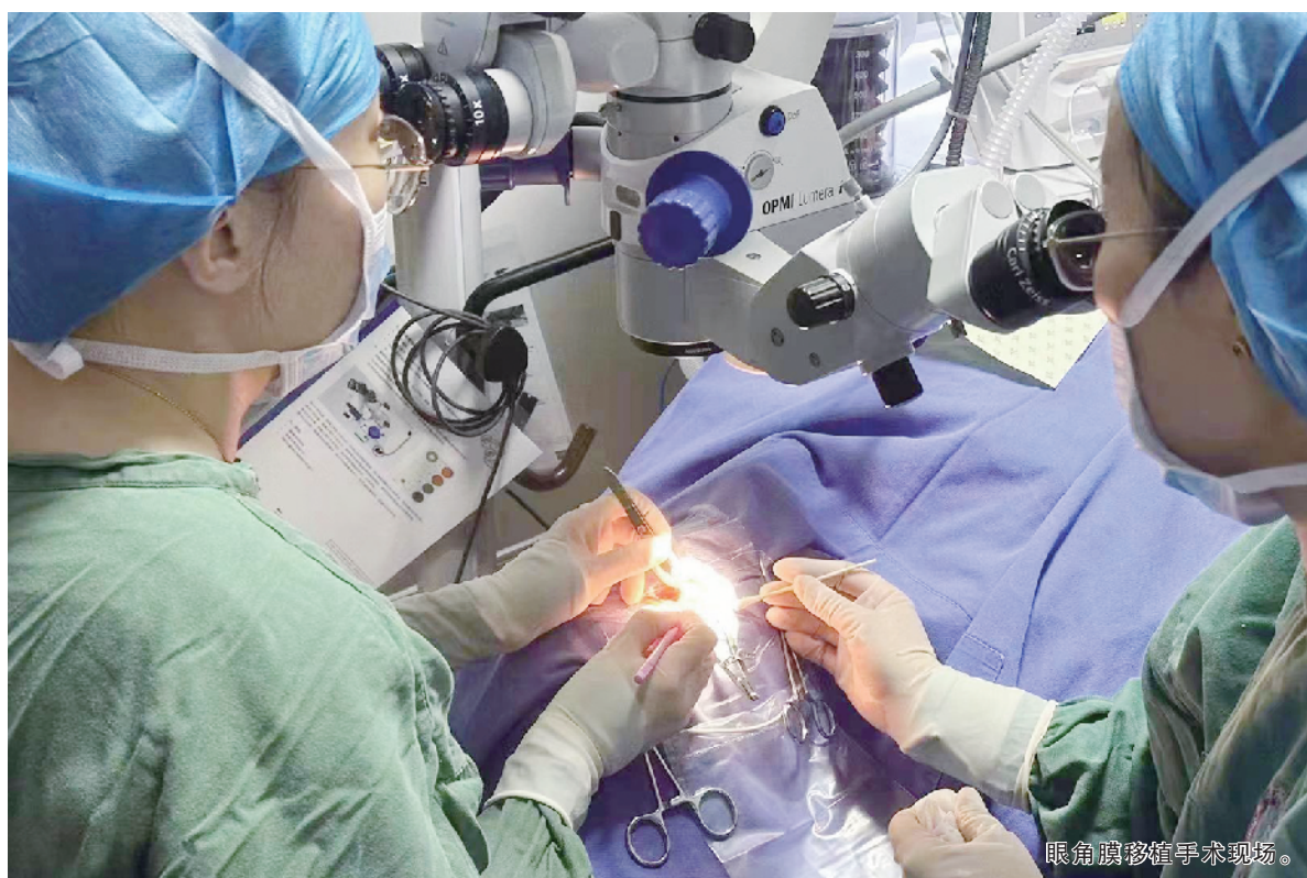
眼角膜移植手术现场。

据了解,角膜病是致盲眼病之一。目前全国的角膜盲人占全部盲人总数的四分之一,人数将近120万,其中,9岁以下、40岁至69岁的